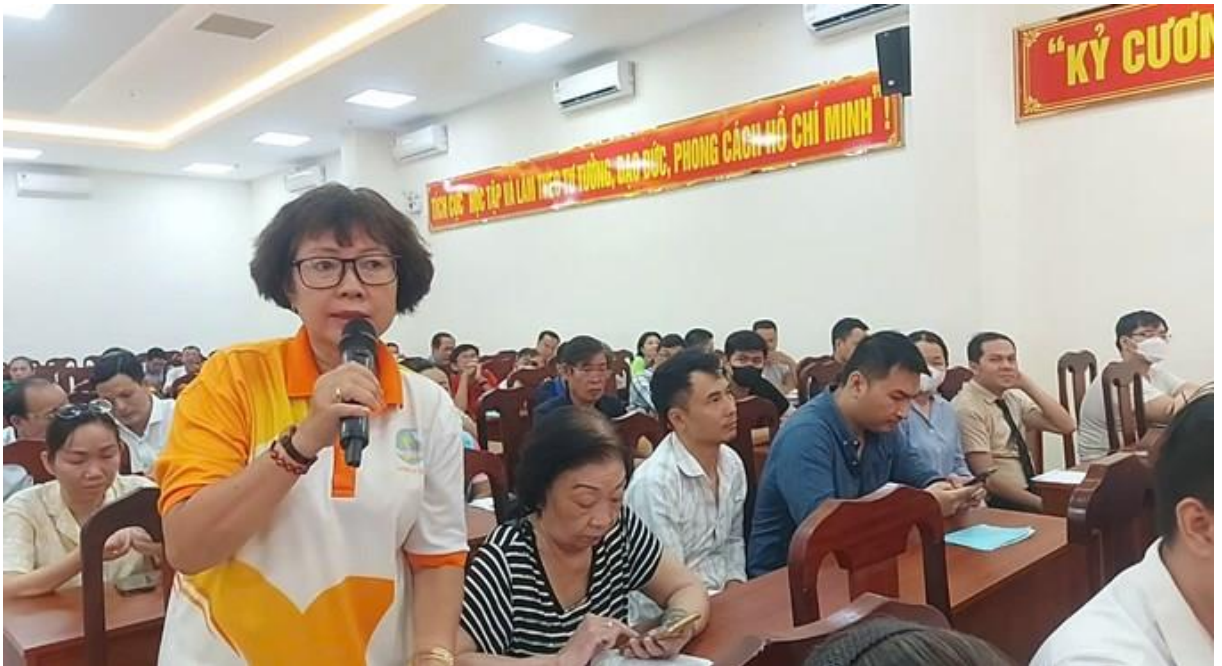
Đại diện cơ sở và người dân nêu một số thắc mắc trong quá trình thực hiện