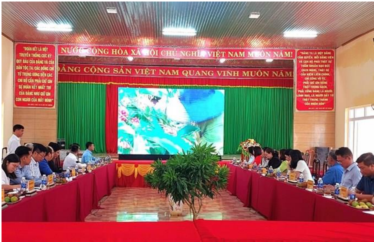
Buổi làm việc về thực hiện bản ghi nhớ hợp tác phát triển kinh tế - xã hội giai đoạn 2024 – 2025 giữa UBND Quận 3 và UBND huyện Tuy Đức

Ngày 16 và 17/7, đoàn công tác của Ủy ban nhân dân Quận 3 do đồng chí Phạm Thị Thúy Hằng – Quận ủy viên, Phó Chủ tịch Ủy ban nhân dân Quận 3 cùng đại diện lãnh đạo các tổ chức chính trị - xã hội, các phòng chuyên môn và Hội Doanh nghiệp Quận 3, đã đi khảo sát thực tế và đánh giá thực trạng một số địa điểm trên địa bàn huyện Tuy Đức, Tỉnh Đắk Nông và có buổi làm việc cùng Ủy ban nhân dân huyện Tuy Đức để xác định nhu cầu về triển khai thực hiện bản ghi nhớ hợp tác phát triển kinh tế - xã hội giữa Quận 3, Thành phố Hồ Chí Minh và huyện Tuy Đức, tỉnh Đắk Nông giai đoạn 2024 – 2025.