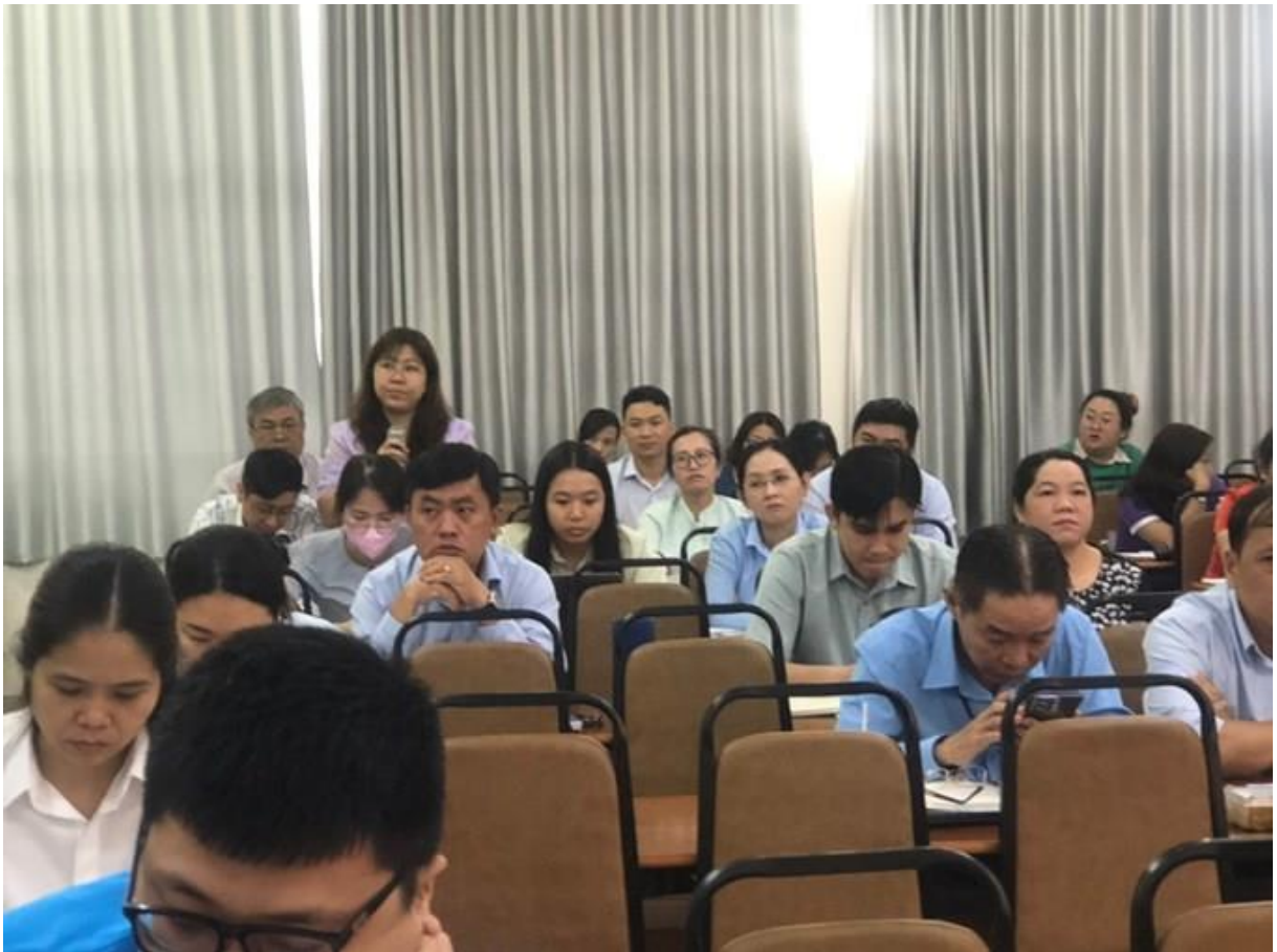
Công chức Phường 11 Quận 3 nêu vấn đề thắc mắc về tình huống tiếp công dân.

Khoản 2 Điều 4 Thông tư số 05/2021/TT-TTCT ngày 01 tháng 10 năm 2021 của Thanh tra Chính phủ quy định quy trình xử lý đơn khiếu nại, đơn tố cáo, đơn kiến nghị, phản ánh quy định: Xử lý đơn là việc cơ quan, tổ chức, đơn vị, người có thẩm quyền căn cứ vào nội dung vụ việc được trình bày trong đơn mà phân loại nhằm thụ lý giải quyết đơn thuộc thẩm quyền, hướng dẫn hoặc chuyển đơn đến cơ quan, tổ chức, đơn vị, người có thẩm quyền giải quyết theo quy định của pháp luật.