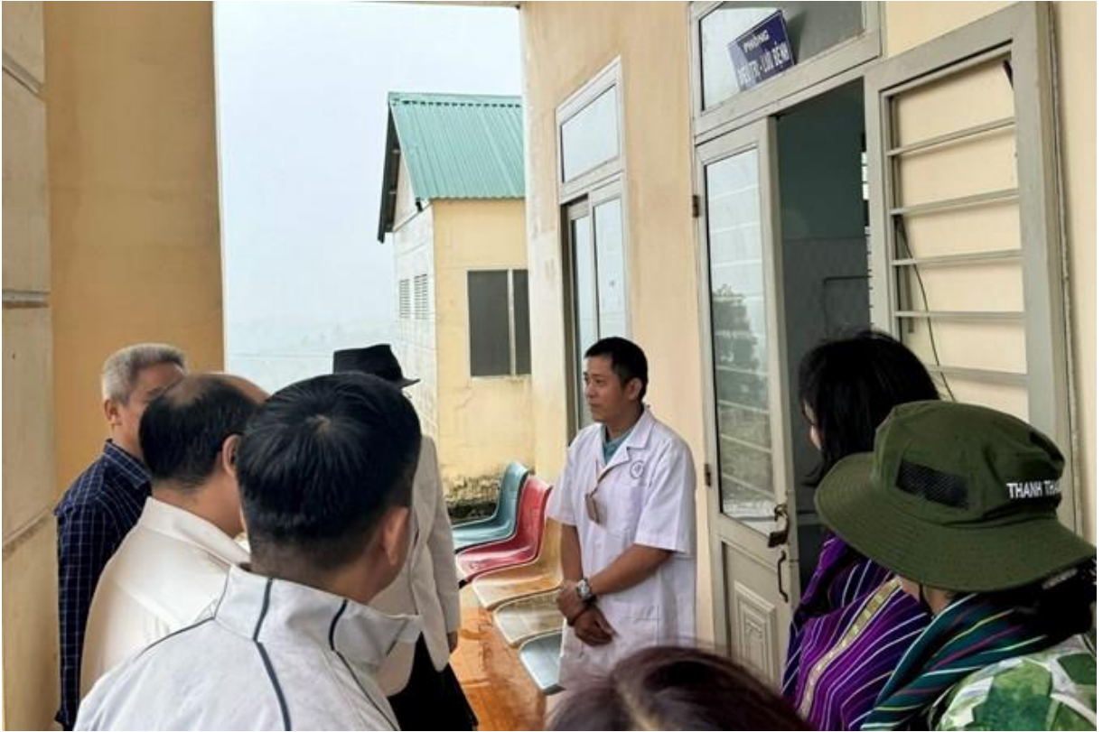
Đoàn công tác khảo sát tại Trạm Y tế xã Quảng Trục, huyện Tuy Đức, tỉnh Đắk Nông